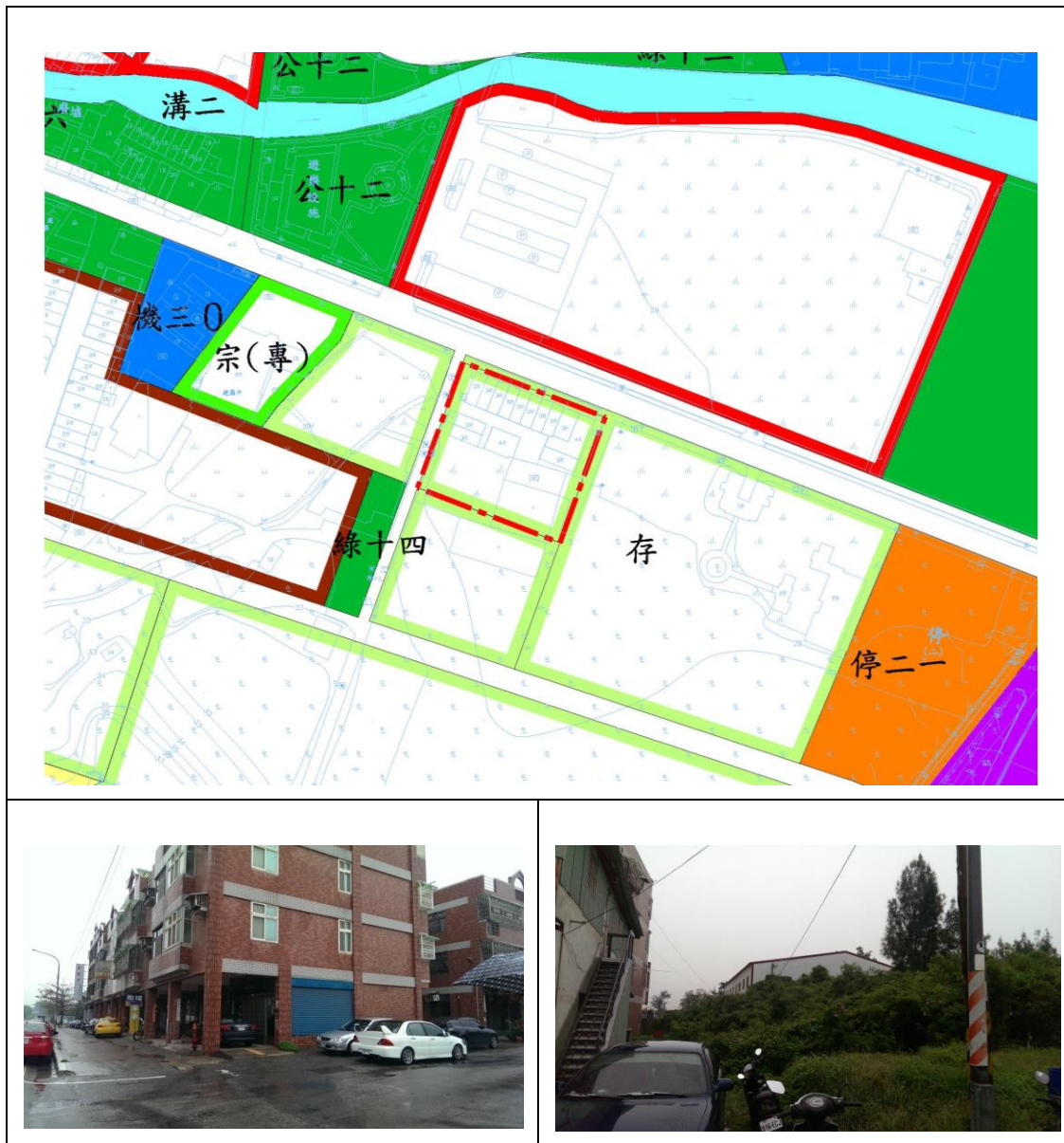
圖二 變更金門特定區計畫(第一次通盤檢討 - 第二階段回饋協議案)土地使用現況圖