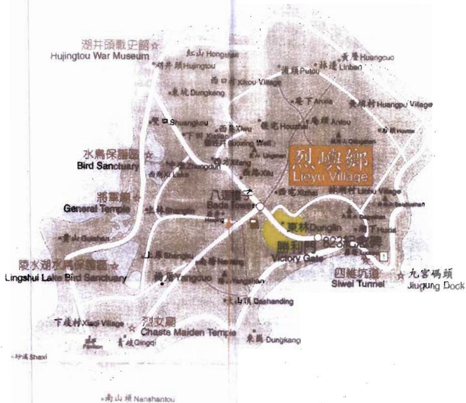
圖一 變更金門特定區計畫（部分文教區為機關用地）位置示意圖